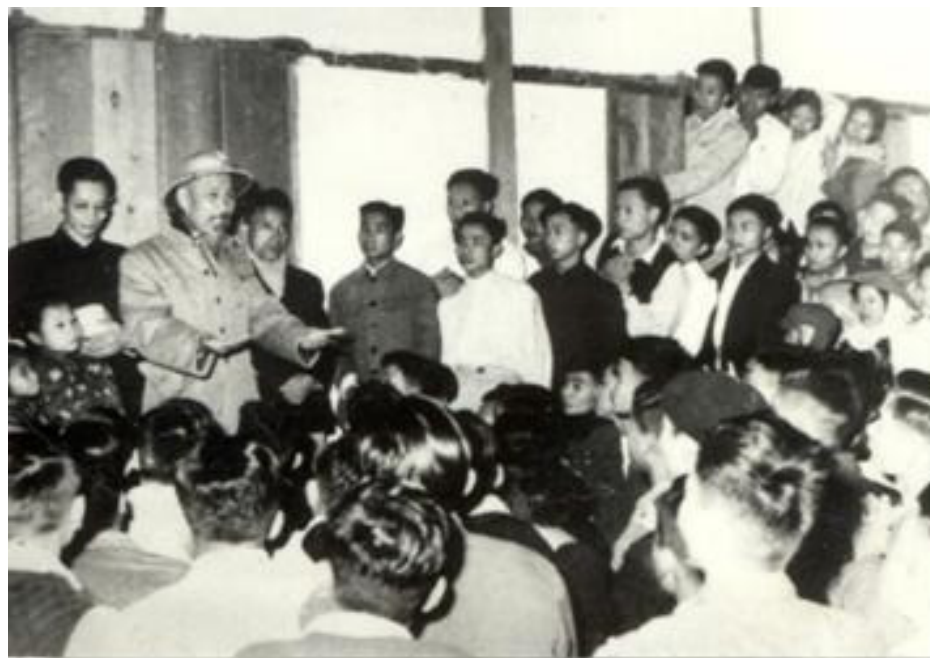
Hình: Bác Hồ nói chuyện với cán bộ và sinh viên Bách khoa tại nhà ở sinh viên sáng mừng một Tết Mậu Tuất (1958)

chìm đắm trong các trò chơi điện tử, trong cuộc sống ảo trên mạng, vui mình trong các cuộc ăn chơi, đua đòi... thì những lời dạy của Bác càng có giá trị lớn hơn bao giờ hết. Nhưng làm thế nào để những lời dạy quý báu đó của Người thấm nhuần tới được với học sinh, sinh viên, giúp các em hình thành được lý tưởng và nếp sống đúng đắn? Trách nhiệm đó không chỉ của riêng ai, mà là trách nhiệm của toàn xã hội, trước hết là của các bậc làm cha làm mẹ, của các nhà giáo dục, các nhà quản lý trong lĩnh vực có liên quan tới thanh thiếu niên.