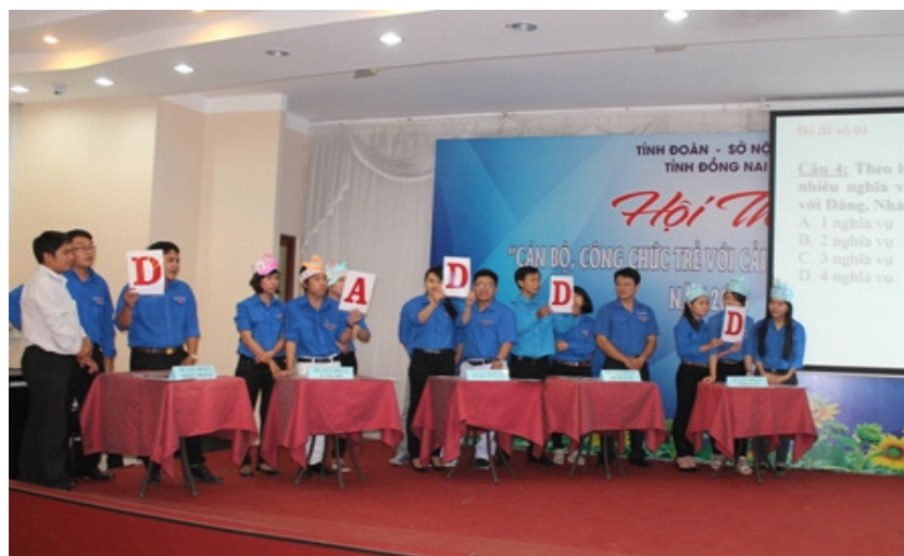
Hình: Các đội tham gia phần thi kiến thức

Chiều 16/12/2015, tại Hội trường Hội quán Văn miếu Trần Biên, Ban Thường vụ Tỉnh đoàn phối hợp Ban Giám đốc Sở Nội vụ tổ chức Hội thi “Cán bộ, công chức trẻ với cải cách hành chính” năm 2015 với sự tham gia của 14 đội thi đến từ các huyện, thị, thành Đoàn và Đoàn khối Cơ quan tỉnh.