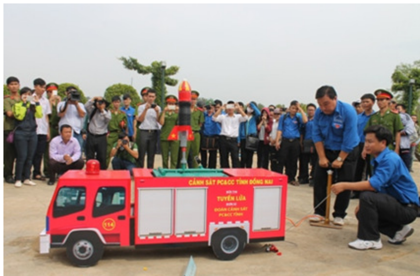
Hình: Phân thi "Sáng tạo Tên lửa nước" của đơn vị Đoàn thanh niên Sở Cảnh sát phòng cháy chữa cháy tỉnh Đồng Nai

Nhằm khuyến khích, cổ vũ đoàn viên thanh niên phát huy các ý tưởng, phát minh sáng chế, đề tài khoa học, cải tiến kỹ thuật, hợp lý hoá sản xuất, làm chủ và ứng dụng khoa học - công nghệ góp phần phát triển kinh tế - xã hội; tôn vinh, khen thưởng những tập thể, cá nhân có các mô hình, đề tài, sáng kiến, sản phẩm sáng tạo hiệu quả được áp dụng trong học tập, lao động sản xuất, công tác, Ban Thường vụ Tỉnh Đoàn phối hợp với Sở Khoa học & Công nghệ tổ chức Ngày hội “Tuổi trẻ sáng tạo” tỉnh Đồng Nai năm 2015 tại Hội quán Văn miếu Trần Biên vào sáng ngày 16/12/2015.