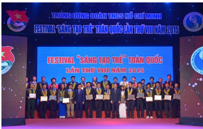
Hình: 36 công trình, sản phẩm sáng tạo tiêu biểu của thanh niên tuyên dương lần này được lựa chọn từ 225 hồ sơ đề cử của 46 Tỉnh, Thành đoàn và Đoàn trực thuộc.

Đồng chí Nguyễn Anh Tuấn – Bí thư Trung ương Đoàn nhấn mạnh: “Những công trình sáng tạo tuyên dương trong Festival “Sáng tạo trẻ” được triển khai áp dụng trong thực tế và mang lại hiệu quả to lớn trong phát triển kinh tế xã hội, đảm bảo quốc phòng an ninh và nguồn lợi kinh tế của đất nước. Năm 2015 với chủ đề “Tự hào tiến bước dưới cờ Đảng”, phong trào Sáng tạo trẻ được triển khai sâu rộng đến tất cả các đối tượng đoàn viên, thanh niên trên cả nước và thực sự là những mô hình, sản phẩm có ý nghĩa. Festival lần này cũng là dịp để vinh danh những sản phẩm, ý tưởng sáng tạo mà thanh thiếu nhi đề xuất về việc tiết kiệm và sử dụng hiệu quả năng lượng. Những công trình, sản phẩm, ý tưởng ngày hôm nay tiêu biểu cho tinh thần sáng tạo, cho trí tuệ của thế hệ trẻ Việt Nam trên khắp mọi miền đất nước”.