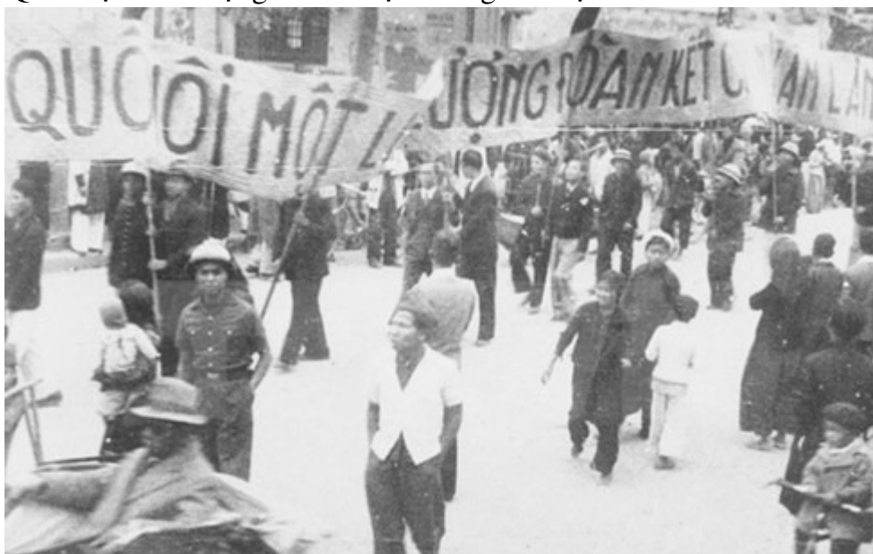
Hình: Nhân dân lao động Thủ đô cổ động cho ngày Tổng Tuyển cử đầu tiên.

Thắng lợi của cuộc Tổng tuyển cử đầu tiên đã khai sinh Quốc hội nước Việt Nam Dân chủ Cộng hòa, nay là Quốc hội nước Cộng hòa xã hội chủ nghĩa Việt Nam.