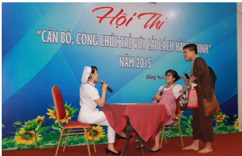
Hình: Tiểu phẩm tham gia tại Hội thi