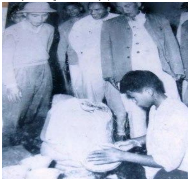
Bác Hồ thăm làng gốm Bát Tràng

Bác cười bảo: Sao chú không nói là phần lớn nguyên liệu mà lại nói là đại bộ phận?